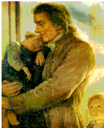
Pestalozzi- professor de Allan Kardec