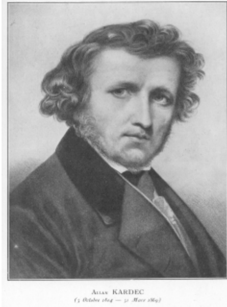
Allan Kardec – jovem

Denizard Rivail era um alto e belo rapaz, de maneiras distintas, humor jovial na intimidade, bom e gentil, que em 1822 mudou-se para Paris.